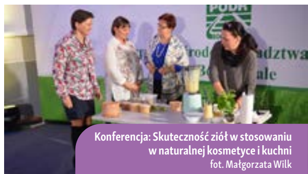
Konferencja: Skuteczność ziół w stosowaniu w naturalnej kosmetyce i kuchni

Podkreślano szczególne znaczenie ziół zarówno w perspektywie historycznej, jak i tej przyszłościowej – pokazując, jak zielarstwo może wpłynąć na rozwój i promocję obszarów wiejskich. Konferencja odbywała się hybrydowo. W Podkarpackim