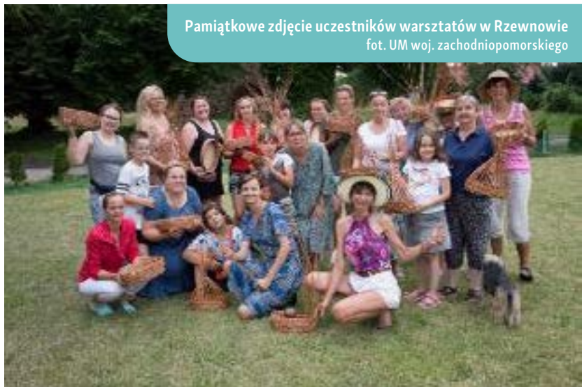
Pamiętkowe zdjęcie uczestników warsztatów w Rzewnowie

Wzmacnianie więzi międzyludzkich i międzypokoleniowych poprzez korzystanie z bogactwa dziedzictwa kulturowego to klucz do budowania silnej społeczności, gotowej do kontynuowania i rozwijania wartości przekazywanych z pokolenia na pokolenie.