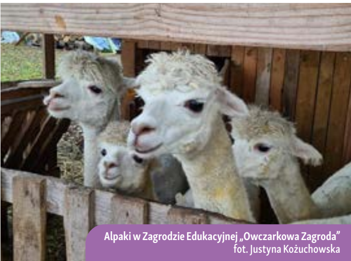
Alpaki w Zagrodzie Edukacyjnej „Owczarkowa Zagroda”