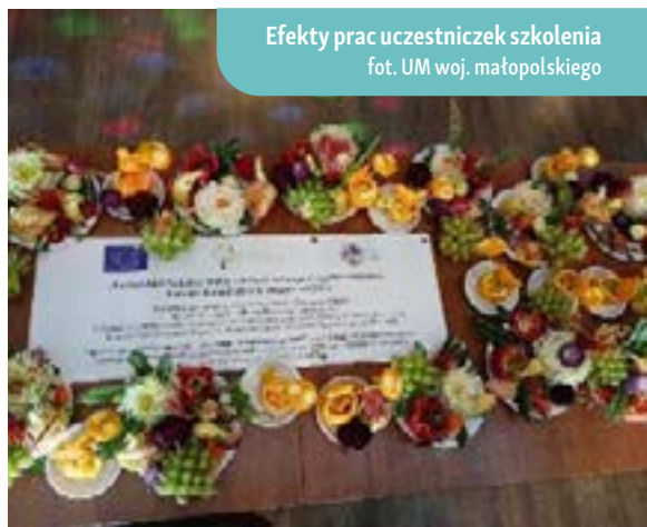
Efekty prac uczestniczek szkolenia

Dodatkową wartością były kontakty nawiązane między uczestnikami a partnerami projektu, co stworzyło możliwość dalszej współpracy przy przyszłych projektach. Partner KSOW, realizując projekt ponownie, dostrzegł ogromny potencjał w lokalnej społeczności i znaczenie integracji społeczności lokalnej.