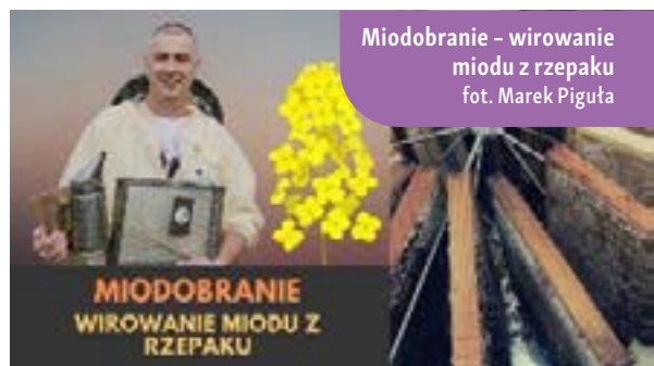
Miodobranie – wirowanie miodu z rzepaku

Pszczółka miodna pojawiła się na Ziemi około 100 milionów lat temu!