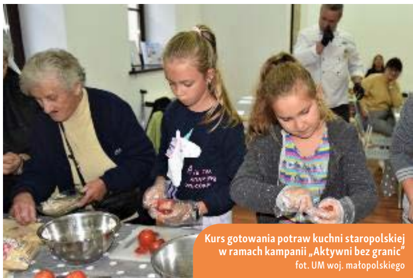
Kurs gotowania potraw kuchni staropolskiej w ramach kampanii „Aktywni bez granic”