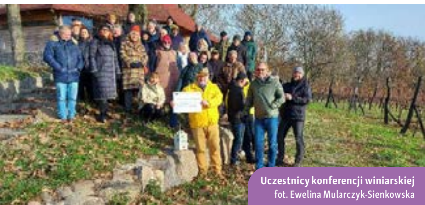
Uczestnicy konferencji winiarskiej

Rozwój sektora winiarskiego to nie tylko sztuka tworzenia wybornych win, ale także proces ciągłego doskonalenia i dostosowywania się do zmieniających się warunków i wymagań rynku. Dlatego też, w kontekście dzisiejszych wyzwań rolniczych i spożywczych, zgłębienie najnowszymi rozwiązań w produkcji, ochronie i pielęgnacji winorośli ma kluczowe znaczenie. III Konferencja Winiarska pt. „Innowacje w uprawie,