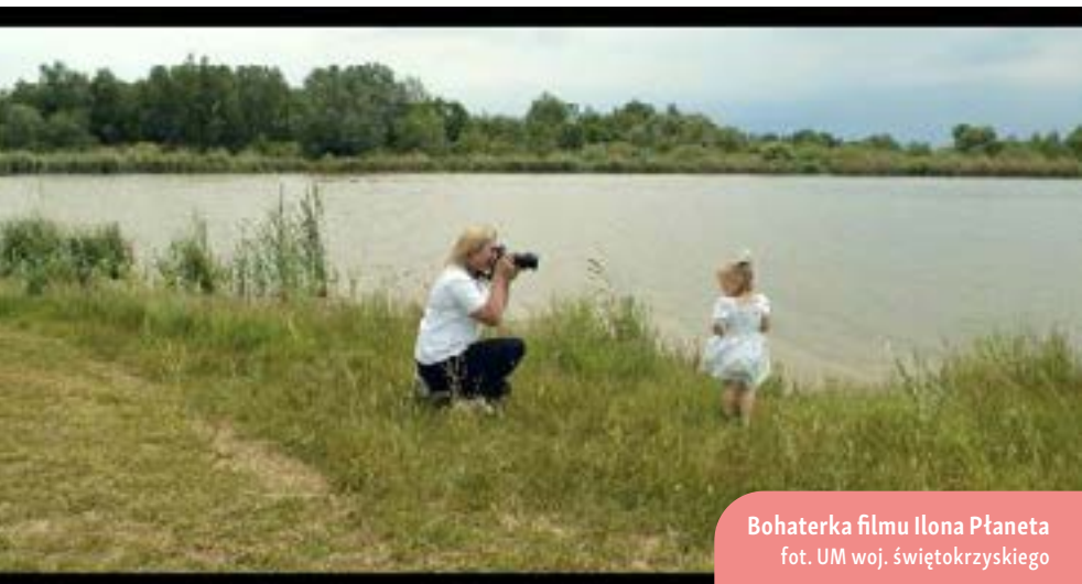
Bohaterka filmu Ilona Płaneta

z tymi wyzwaniami. Film stał się efektywnym narzędziem do prezentacji kreatywności i przedsiębiorczości kobiet, opierając się na pozytywnych przykładach z różnych gmin regionu świętokrzyskiego. Zyskał on wiele pozytywnych recenzji, a bohaterki filmu, zgodnie z celem projektu, stały się źródłem inspiracji dla innych mieszkanek obszarów wiejskich, dla których przedsiębiorczość jest kluczowym czynnikiem rozwoju.