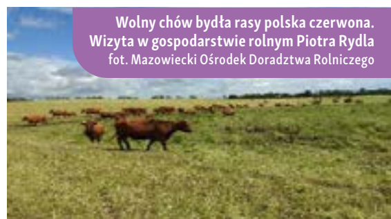
Wolny chów bydła rasy polska czerwona. Wizyta w gospodarstwie rolnym Piotra Rydla

Współpraca w ramach programu PROW poskutkowała wprowadzeniem nowej technologii w żywieniu zwierząt. Dzięki temu skrócono czas opasu bydła z 24 do 20-22 miesięcy. Operacja polegała na wprowadzeniu lepszych sposobów dbania o zdrowie zwierząt, ich karmienie i monitorowanie, co poprawiło efektywność