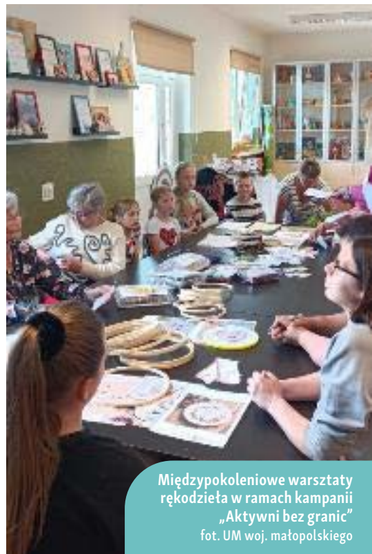
Międzypokoleniowe warsztaty rękodzieła w ramach kampanii „Aktywni bez granic”

Zorganizowane w ramach projektu warsztaty przyciągnęły 50 uczestników. Była to liczba zakładana na etapie planowania przedsięwzięcia. Realizowany program obejmował spotkania warsztatowe dla wyżej wymienionych grup społecznych, a przy tym zainicjowanie tworzenia inspirujących miejsc pracy na obszarach wiejskich. Dzięki programowi „Aktywni bez granic” udało się wykreować przestrzeń, w której różnorodne grupy społeczne mogły wspólnie pracować nad rozwojem swoich obszarów wiejskich i planować lepszą przyszłość.