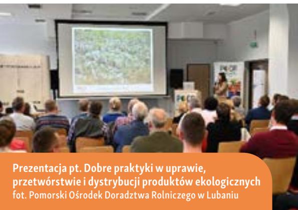
Prezentacja pt. Dobre praktyki w uprawie, przetwórstwie i dystrybucji produktów ekologicznych

przez Dyrektora Pomorskiego Ośrodka Doradztwa Rolniczego w Lubaniu. W efekcie, wyłoniono laureatów z województwa pomorskiego, którzy zakwalifikowali się do drugiego – krajowego etapu konkursu.