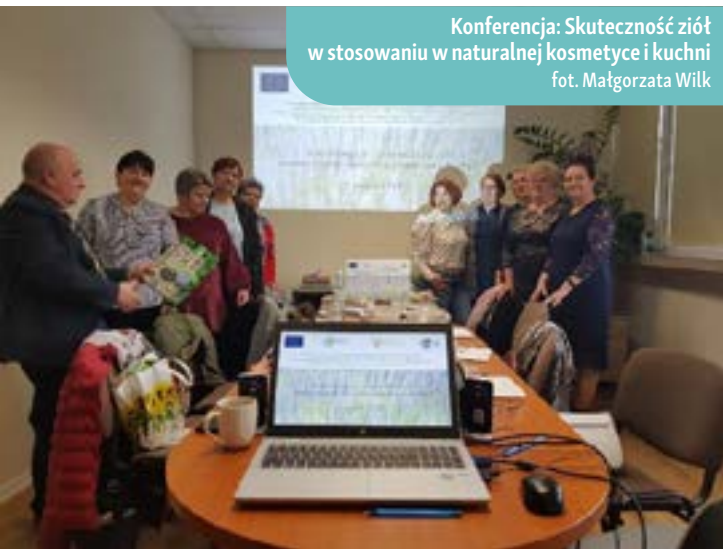
Konferencja: Skuteczność ziół w stosowaniu w naturalnej kosmetyce i kuchni