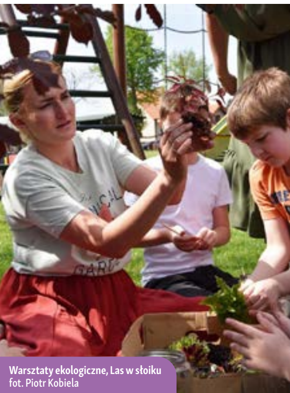
Warsztaty ekologiczne, Las w słoiku