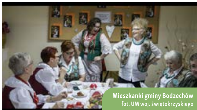
Mieszanki gminy Bodzechów

W projekcie wzięło udział 8 beneficjentek Programu Rozwoju Obszarów Wiejskich z województwa świętokrzyskiego. Wśród uczestniczek projektu znajdują się kobiety, które zarządzają własnymi przedsiębiorstwami oraz pełnią funkcje liderów w organizacjach pozarządowych. Między innymi, w filmie wzięła udział dyrektorka biura Lokalnej Grupy Działania, co przyczyniło się do zwiększenia świadomości i rozpowszechnienia wiedzy na temat dostępnych form wsparcia dla przedsiębiorczości na obszarach