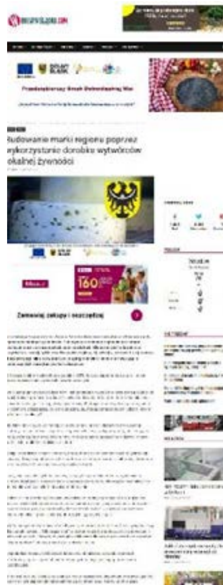
Banner Informacyjno-promocyjny Autor: Małgorzata Molenda Grafika dotycząca artykułu „Budowanie marki regionu poprzez wykorzystanie dorobku wytwórców lokalnej żywności” Autor: Karolina Brzemkowska