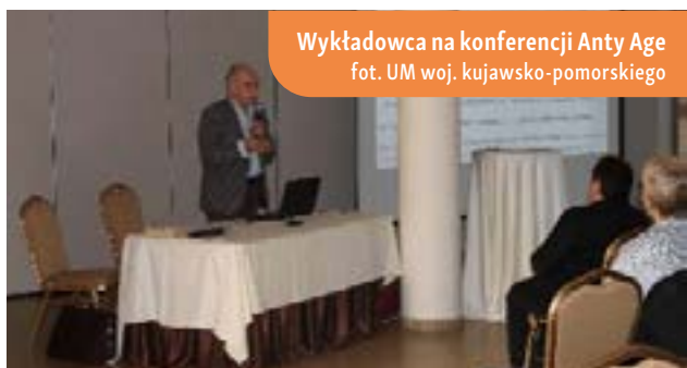
Wykładowca na konferencji Anty Age

W kolejnej prezentacji, zatytułowanej „ Właściwości zdrowotne starych gatunków zbóż ”, omówiono korzyści zdrowotne takich pszenic jak samopsza, płaskurka i orkisz. W ramach konferencji odbył się również wykład na temat wpływu żywności