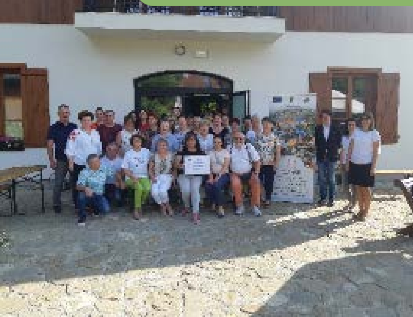
Uczestnicy wyjazdu studyjnego w Zagrodzie w Pacanach

smaku i wartości odżywczych. Dodatkowo, wspierając lokalnych dostawców, budujemy zapotrzebowanie na konkretne towary i wspieramy rynek w regionie.