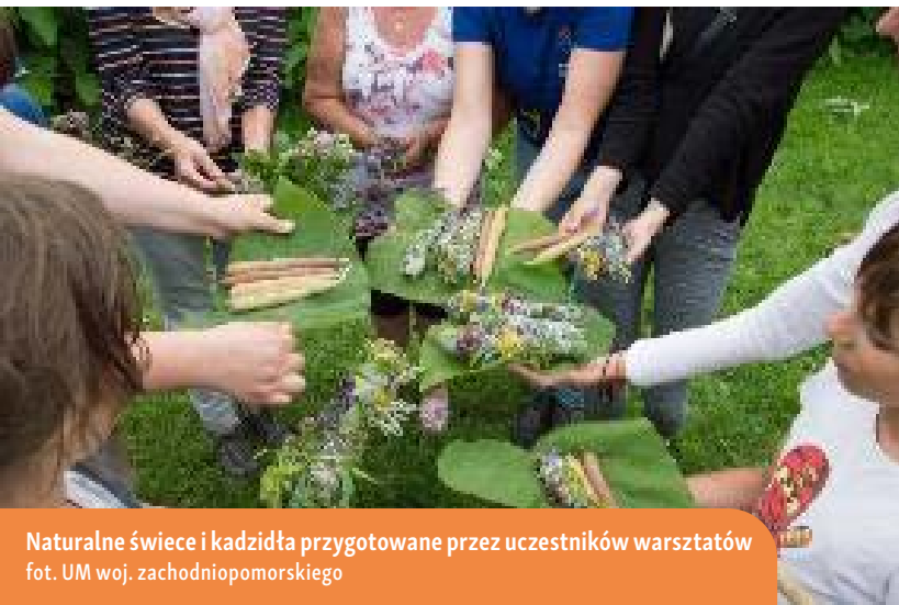
Naturalne świece i kadzidła przygotowane przez uczestników warsztatów

Do prowadzenia warsztatów w ramach projektu zaproszono osoby, które od lat z zaangażowaniem i pasją pielęgnują regionalne tradycje. Dzięki ich zaangażowaniu uczestnicy projektu mieli okazję nie tylko poznać, lecz również praktycznie doświadczyć tradycji ludowych, rzemieślniczych oraz korzystania z naturalnych zasobów otaczającego środowiska. Takie oddolne inicjatywy mogą stanowić siłę napędową kształtującą kreatywność i przywiązanie lokalnej społeczności do tradycji w kolejnych latach.