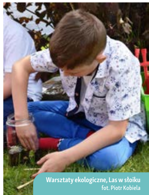
Warsztaty ekologiczne, Las w słoiku

Każdy z uczestników przygotował także zielony obraz ze zgromadzonych kamieni, roślin, patyków, zieloną instalację przy użyciu plastikowych odpadów czy zielony las w słoiku.