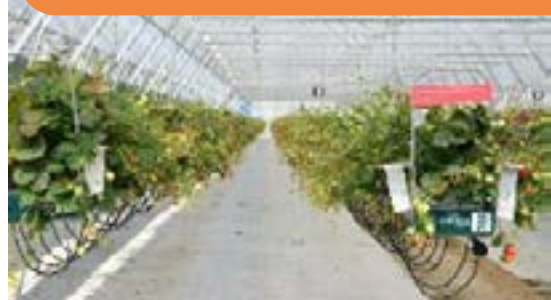
Plantacja truskawek w miejscowości Czechy k. Krakowa

Uczestnicy wyjazdu byli bardzo zadowoleni z możliwości zapoznania się z nowoczesnymi systemami uprawy, co przejawiało się w wysokich ocenach programu. W dalszym etapie projektu oczekuje się, że jego rezultatem będzie zastosowanie innowacyjnych rozwiązań przez producentów w ich własnych gospodarstwach, a co za tym idzie, zwiększenie konkurencyjności i rentowności sektora truskawek w woj. świętokrzyskim.