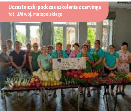
Uczestniczki podczas szkolenia z carvingu

Od dawna wiadomo, że jemy nie tylko ustami, ale też oczami. Estetyka pożywienia odgrywa dużą rolę w gastronomii, ale też m.in. w turystyce. Jedną z metod dekorowania potraw jest carving – sztuka rzeźbienia w owocach i warzywach, która była przedmiotem warsztatów zorganizowanych przez Stowarzyszenie Lokalna Grupa Działania Turystyczna Podkova. Zadaniem przeprowadzonej operacji było zwiększenie wiedzy i zdolności uczestników w obszarze tworzenia dekoracji z owoców i warzyw przez zorganizowanie szeregu warsztatów. Działanie to miało także na celu wyrównanie możliwości i wykorzystanie potencjału kobiet we wspieraniu lokalnego rozwoju, jak również zachęcenie uczestników do poszukiwania dodatkowych sposobów na zarobek poza rolnictwem z wykorzystaniem nabytej podczas warsztatów wiedzy i umiejętności.