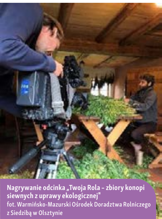
Nagrywanie odcinka „Twoja Rola – zbiory konopi siewnych z uprawy ekologicznej”