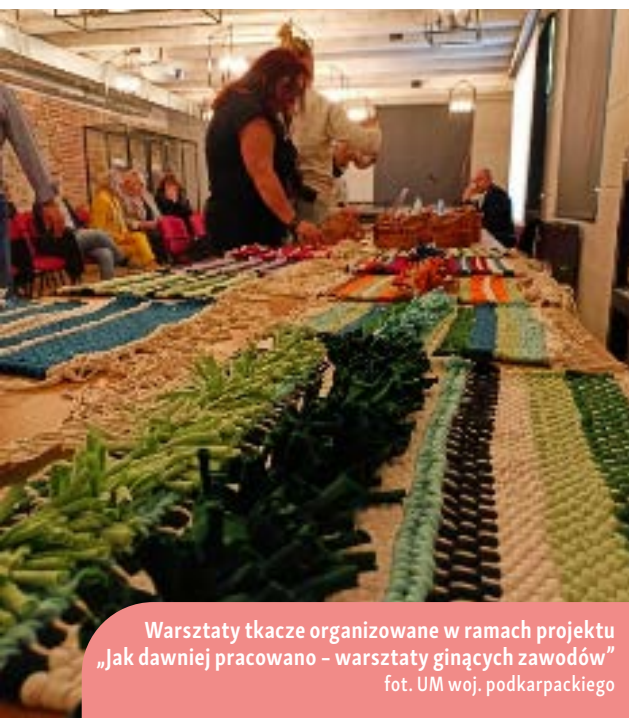
Warsztaty tkackie organizowane w ramach projektu „Jak dawniej pracowano – warsztaty ginących zawodów”

Inicjatywa „Jak dawniej pracowano” przedstawiała odbiorcom zanikające bogactwo kulturowe, pochodzące z tradycji ludowej. Miała przekazywać i utrzymywać tradycyjne wartości wśród mieszkańców gminy Zagórz. Obejmowała przede wszystkim zaangażowanie w zachowanie tradycji oraz promowanie znajomości zawodów, które w niewielkim stopniu są kultywowane współcześnie: tkactwo, wikliniarstwo czy ceramika. W warsztatach wzięło udział 100 osób.