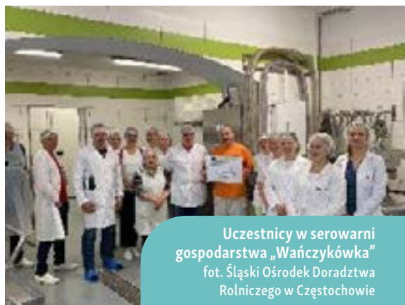
Uczestnicy w serowni gospodarstwa „Wańczykówka”

Uczestnicy mogli zdobytą wiedzę sprawdzić w praktyce, przygotowując różne próbki jogurtów. Zwieńczeniem było wprowadzenie uczestników w tajniki pielęgnacji i przechowywania serów oraz zakończenie i podsumowanie własnej produkcji sera feta. Dzień trzeci przeznaczono na podsumowanie nowej wiedzy i networking uczestników.