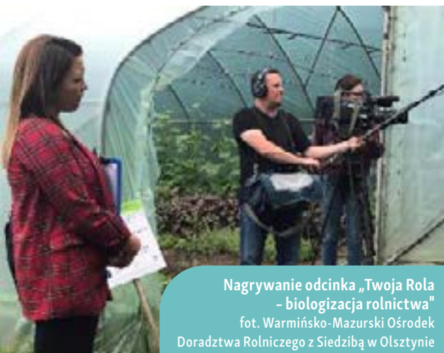
Nagrywanie odcinka „Twoja Rola - biologizacja rolnictwa”

inkubatorem jest przedsiębiorstwo, które udostępnia odpowiednią infrastrukturę lokalnym producentom rolnym i przetwórcom, aby ci mogli przerobić swoje produkty rolne.