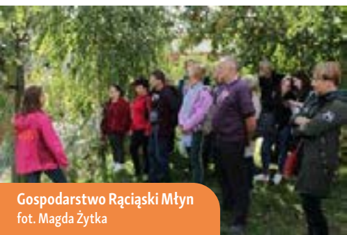
Gospodarstwo Rąciański Młyn

W miejscowości Bochlin, w gospodarstwie Toskania Kociewska, na terenie podwórza znajduje się amerykańska ciężarówka, która oferuje miejsca noclegowe dla pięciu osób. Pojazd ten jest w pełni wyposażony i udostępni gościom łazienkę oraz kuchnię utrzymaną w stylu lat 70-tych.