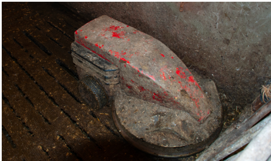
Foto. 1. Autonomiczny robot do usuwania odchodów z rusztów dla bydła.

Częste usuwanie odchodów krów z korytarza gnojowego, opisane jako 3-4 razy dziennie w stosunku do klasycznego 1 raz dziennie, traktowane jest jako metoda redukcji emisji amoniaku, metanu, czy tlenków azotu. Jej efekt sprowadza się do zmniejszenia powierzchni emisji oraz samego wolumenu materiału, z którego pochodzi emisja. Za realizację metody uznać można wykorzystanie samobieżnych odkurzaczy dla systemów rusztowych (foto. 1). Metoda może też być stosowana przy zwykłych zgarniakach oraz przenośnikach podklatkowych dla drobiu nieśnego. Dla tej grupy technologicznej lepszy efekt uzyskuje się stosując podsuszanie pomiotu. Metoda polega na zakupie klatek dla niosek, pod którymi funkcjonuje przenośnik taśmowy transportujący okresowo pomiot do zbiornika-suszarni. Samo suszenie ma charakter nadmuchowy i może też być realizowane w osobnej suszarni. Szacuje się, że metodą tą można uzyskać redukcję do 70% amoniaku.