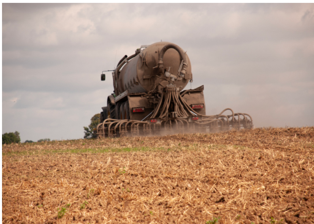
Foto. 3. Doglebowy aplikator gnojowicy z zamknięciem szczeliny (krążkowy).

Dla jakości powietrza szczególne znaczenie posiada GAEC 3 „Zakaz wypalania użytków rolnych”. Zapobiega ona przede wszystkim emisjom dwutlenku węgla (związanym zarówno ze spalaniem substancji organicznych zawartych w biomasie, jak i w glebie), ale również pyłów i innych LZO. SMR 2 wiąże się z przestrzeganiem szeregu wymogów wynikających z dyrektywy azotanowej. Racjonalna gospodarka nawozowa, regulująca kwestie bezpiecznego stosowania i dawkowania nawozów zawierających azot oraz określająca sposoby przechowywania nawozów naturalnych, pozytywnie wpływa na stan jakościowy wód gruntowych i powierzchniowych oraz jakość gleby. Sprzyja także mitygacji emisji gazowych, zwłaszcza amoniaku, tlenu diazotu i metanu, a także emisji pyłów do atmosfery. Ogranicza również powstawanie i rozprzestrzenianie odorów.