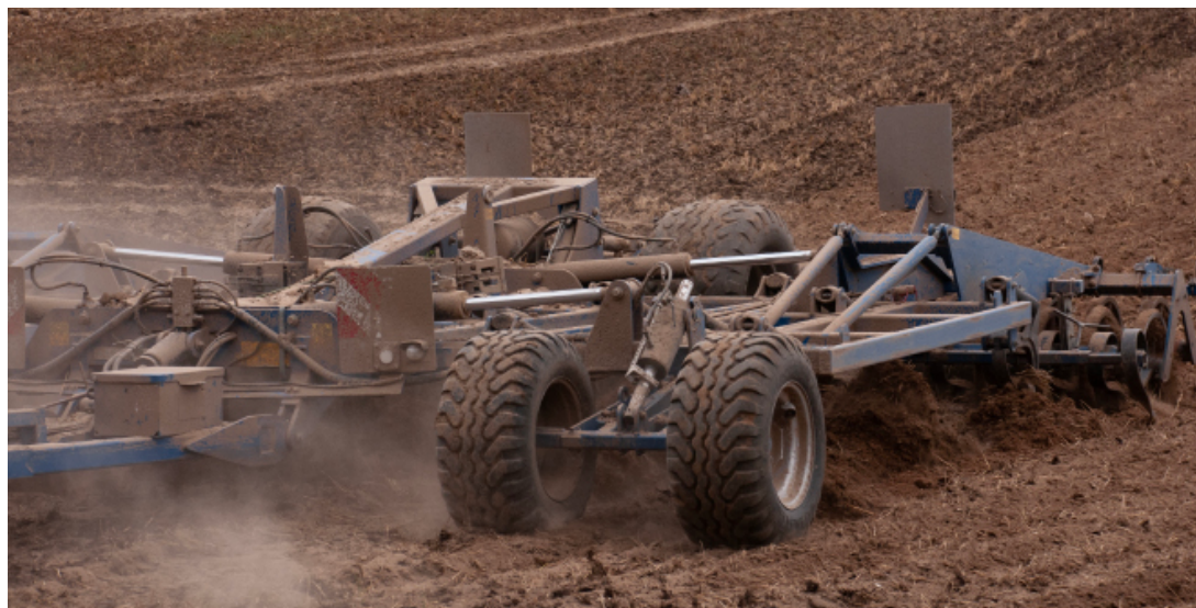
Foto. 2. Szybkie przykrywanie obornika w uprawie uproszczonej.

W zakresie aplikacji nawozów naturalnych, przede wszystkim wspomnieć należy o wykorzystaniu wozów asenizacyjnych, wyposażonych w pompy i przewody dozujące gnojowicę bezpośrednio na glebę lub pod jej powierzchnię (foto.3). Możliwe jest ich wykorzystanie tak na GO, jak i TUZ. Płytką iniekcja gnojowicy redukuje emisję amoniaku o 70-80% (min. na 10 cm), głęboka o 90%, ale tzw. wleczone węże jedynie o 30%. W celu redukcji emisji, nawozy naturalne powinny być jak najszybciej wymieszane z glebą. Przyorywanie do 4 godzin po aplikacji obornika redukuje emisję amoniaku o 60-90%, a natychmiastowe gnojowicy o 70-90%. Po 4 godzinach jest to już tylko 45-65%. Po 24 godzinach tylko 30% emisji amoniaku.